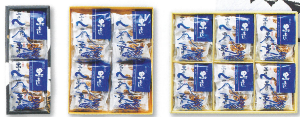
12枚入 594円(税込) 24枚入 1,188円(税込) 36枚入 1,782円(税込)