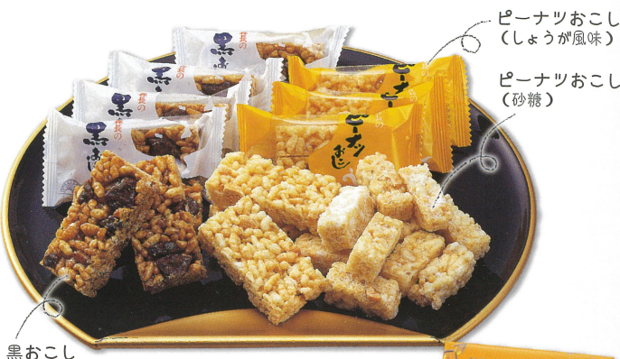
ピーナツおこし (しょうが風味) ピーナツおこし (砂糖)