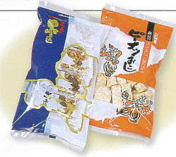
黒おこし8枚入 356円(税込) ピーナツおこし120g 356円(税込)